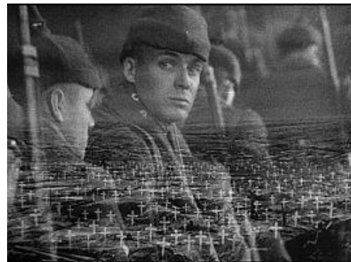
Z filmu Na západní frontě klid