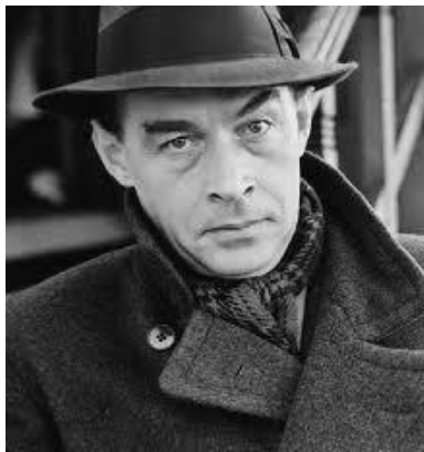
Erich Maria Remarque